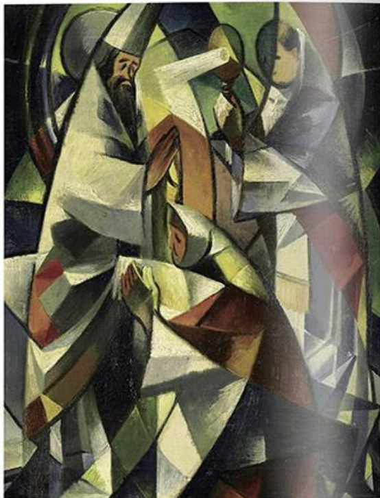
Давид Бурлюк. В церкви. 1922. Частная милостыня