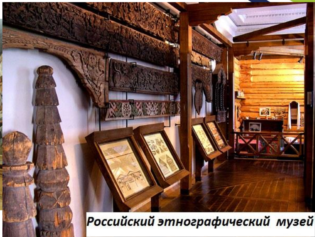
Российский этнографический музей