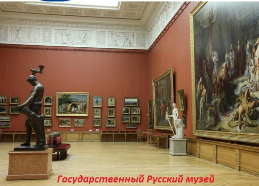
Государственный Русский музей