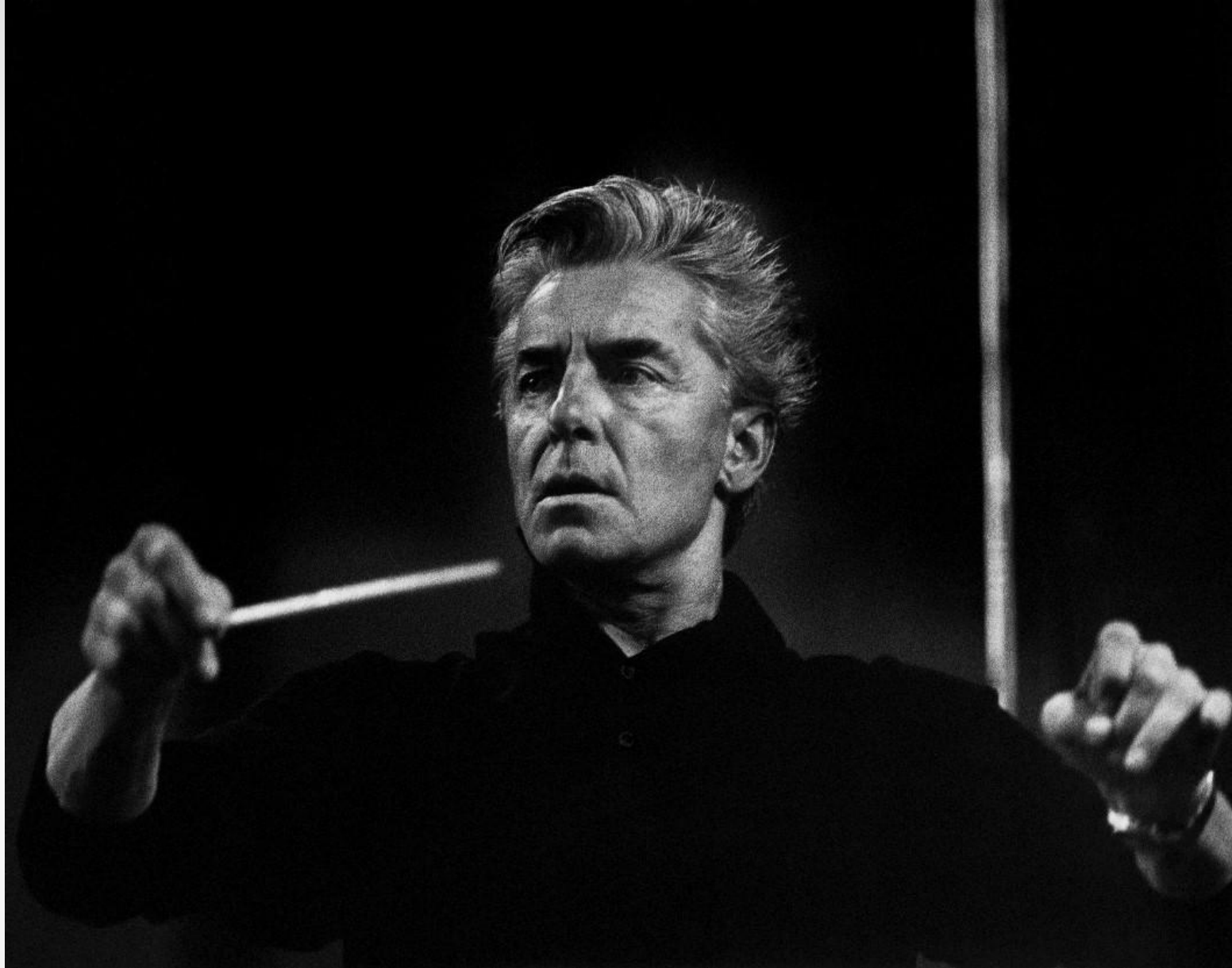
Герберт фон Караян