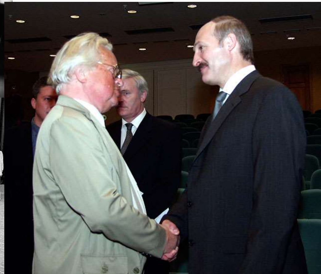
Александр Лукашенко и народный артист СССР Виктор Ровдо. Май 2002 года