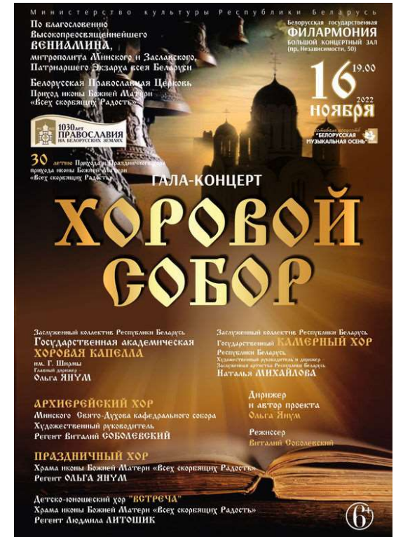
Гала-концерт «Хоровой собор»