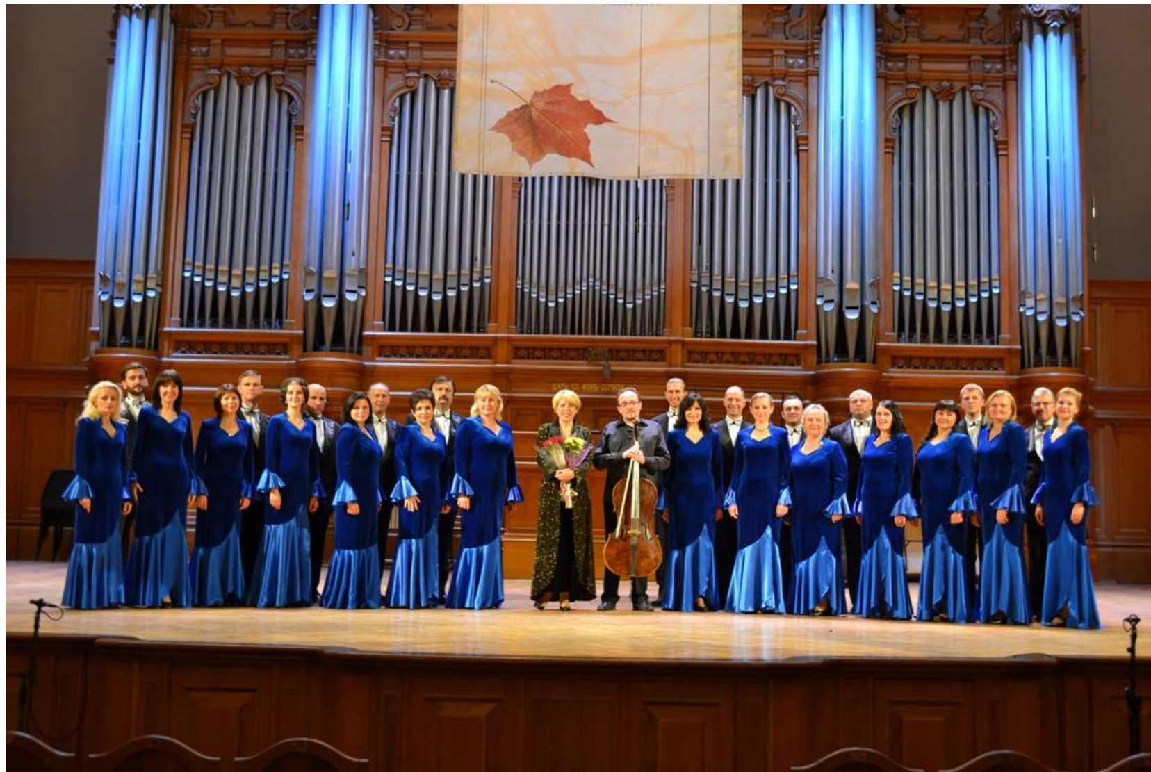
В Большом зале МГК им. П.И. Чайковского