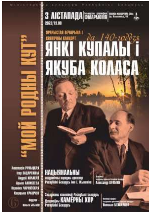
Концерт к 140-летию со дня рождения Я.Купалы и Я.Коласа