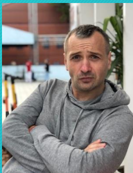
Слесарь Е.А., канд. иск., доцент, куратор программы