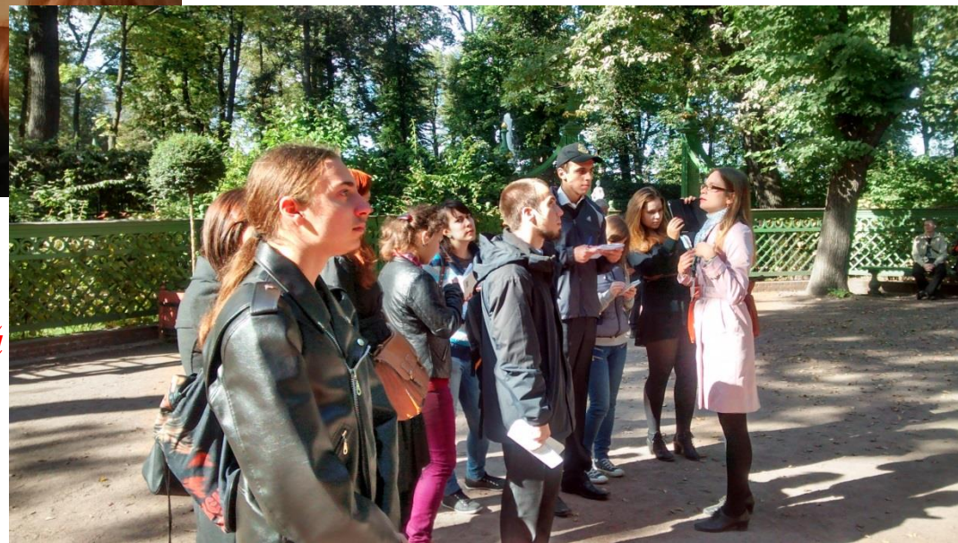
Практика в Летнем саду Государственный Русский музей