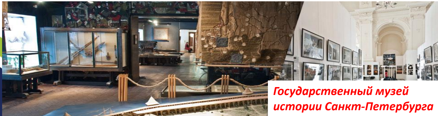
Государственный музей истории Санкт-Петербурга